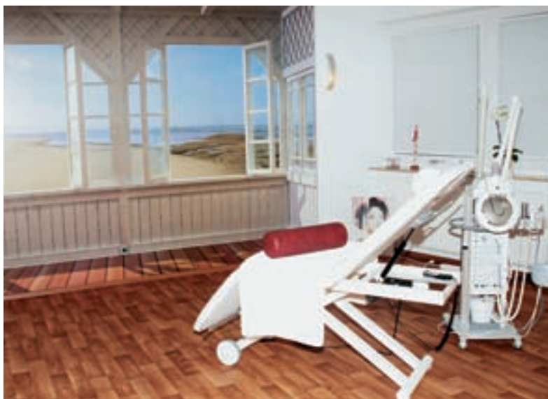
Dank verschiedener Fototapeten gibt es für die Kunden nun Behandlungen mit Meerblick

Bettina Strätlings Kunden dürfen in ihrem Institut „Auszeit“ nicht nur klassische Kosmetik-, Wellness- und Spa-Angebote erwarten, sondern auch etliche therapeutische Behandlungen. Ganz nach dem Motto: Erlebniskosmetik trifft auf Physiotherapie